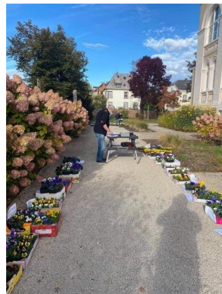
Vente de Pensées

Plus largement, adhérer à l'APEL, c'est rejoindre la plus importante association nationale de parents d'élèves avec plus de 970 000 familles adhérentes, et accéder à de nombreuses ressources pour vous aider dans la scolarité et l'éducation de vos enfants avec notamment :