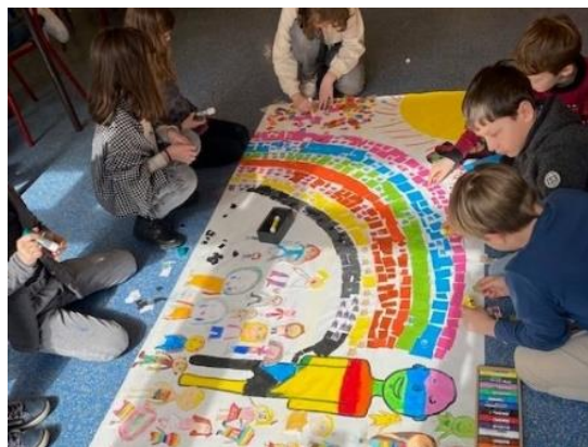
Atelier Art Thérapie au primaire collège

L'APEL Assomption vous souhaite un bel été et une bonne rentrée 2023