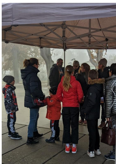
Accueil aux Portes Ouvertes