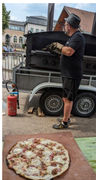
Stand tartes flambées Kermesse