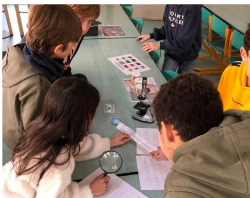
Escape Game autour du gaspillage alimentaire

Retrouvez-nous lors des différentes réunions de rentrée qui se tiendront courant septembre et lors de l'Assemblée Générale de l'APEL Assomption prévue le 26 septembre 2023.