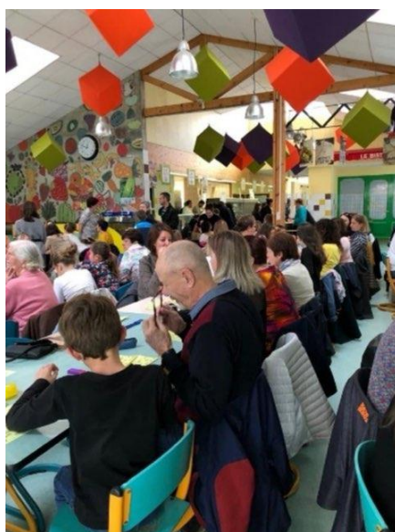
Loto de l'Assomption