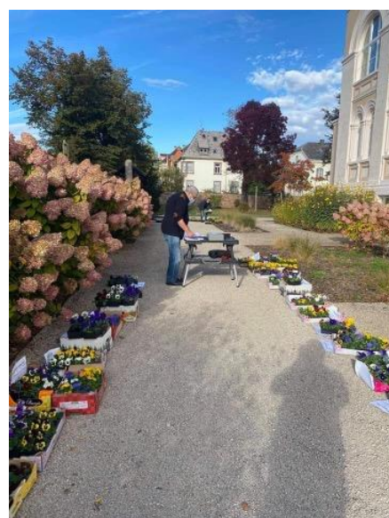
Vente de Pensées