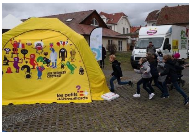
Animations proposées par l'APEL sur le thème des sciences

Retrouvez-nous lors des différentes réunions de rentrée qui se tiendront courant septembre et lors de l'Assemblée Générale de l'APEL Assomption prévue le 07 octobre 2022 .