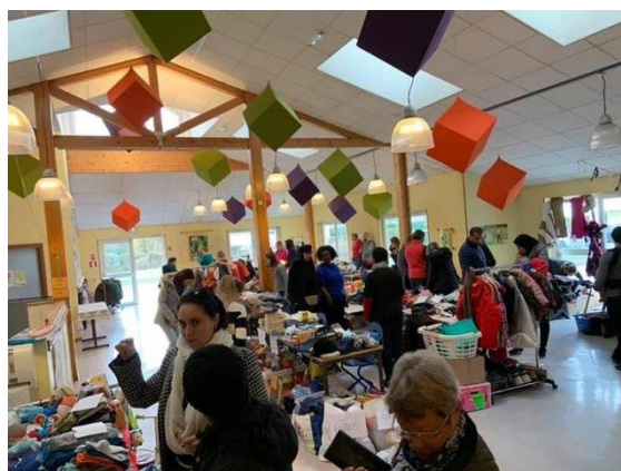
Bourse aux vêtements

L'APEL Assomption vous souhaite un bel été et une bonne rentrée 2022